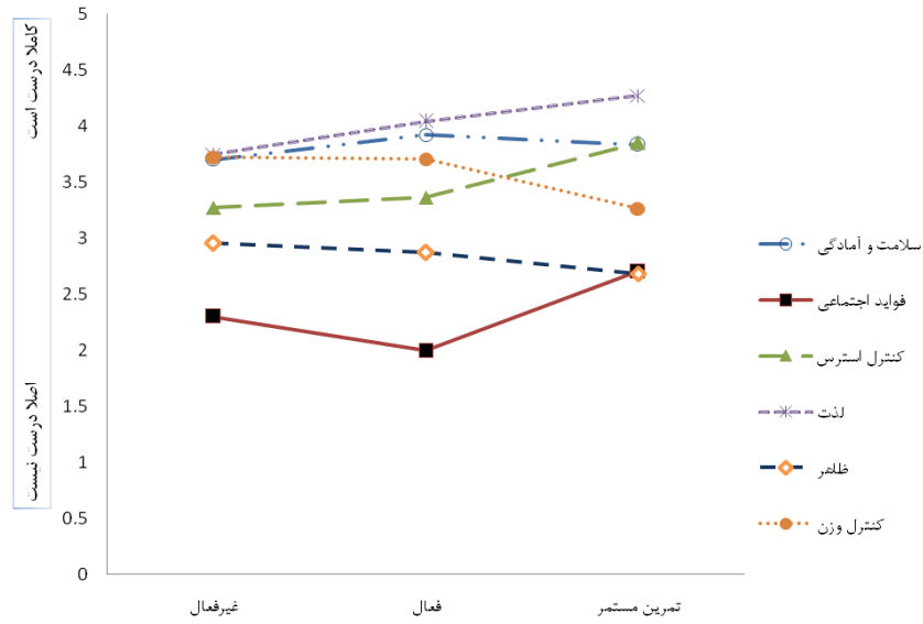
شکل ۲_ میانگین توزیع انگیزه ها در سطوح فعالیت