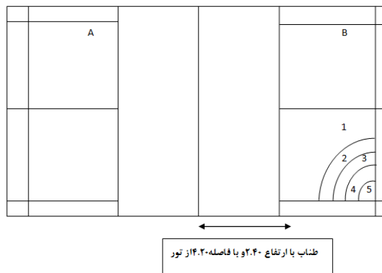
شکل ۱ - نحوه امتیاز دادن به آزمون سرویس بلند بدمینتون اسکات و فاکس

هدف این آزمون اندازه گیری توانایی انجام سرویس بلند بدمینتون تا انتهای زمین حریف و اندازه گیری دقت سرویس بلند است. روایی این آزمون حدود ۵۴ درصد و پایایی آن در حدود ۷۰ درصد گزارش شده است. برای اجرای آزمون، یک طناب کاملاً کشیده و محکم با ارتفاع ۲/۴۰ متر از زمین و به فاصله ۴/۲۰ متر از تور نصب می شود. همچنین دایره هایی با گچ یا نوار در گوشه انتهایی زمین با شعاع ۹۵، ۷۵، ۵۵ و ۱۲۵ سانتی متر از نقطه تقاطع خط طولی و عرضی زمین یک نفره رسم می شود و خطوط ۲ سانتی متری جزء دایره ها محسوب می شود. روش انجام آزمون به این صورت است که مطابق شکل ۱، آزمون شونده در نقطه (A) در قطر زمین مخالف با دایره ها قرار می گیرد و تلاش می کند توپ را با سرویس بلند از روی طناب به سمت آنها بفرستد. هر دایره دارای امتیاز مشخص در شکل است. برای این آزمون ۲۰ سرویس در نظر گرفته شده است و مجموع امتیازهای کسب شده از ۲۰ سرویس، به عنوان امتیاز فرد محسوب می شود. اگر توپ در داخل مناطق تعیین شده فرود آید، امتیاز آن منطقه محاسبه خواهد شد و در صورتی که توپ روی خطوط دایره فرود آید، امتیاز دایره کوچک تر را کسب می کند. آزمونگر باید در جایی قرار گیرد که عبور توپ از روی طناب و فرود آن را بر روی دایره ها به خوبی مشاهده کرده و امتیاز کسب شده را با صدای بلند برای آزمون شونده اعلام کند. به توپ هایی که از روی طناب عبور نکنند، امتیازی تعلق نمی گیرد (۶).