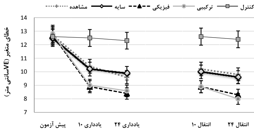
شکل ۱. میانگین عملکرد گروه‌ها در تغییرپذیری پرتاب دارت

اوت (Out): براساس جدول ۱ خلاصه تحلیل واریانس در عامل درون آزمودنی، بیانگر آن است که اثر اصلی مرحله ( \eta^2 p = 0/32 ، P < 0/001 ، F_{(2,110)} = 20/80 ) معنادار است و نیز اثر تعاملی مرحله \times گروه ( \eta^2 p = 0/18 ، P = 0/05 ، F_{(8,110)} = 3/31 ) بر میانگین امتیازات افراد تأثیر دارد. همچنین اثرات بین آزمودنی نشان می‌دهد متغیر گروه ( \eta^2 p = 0/57 ، P < 0/001 ، F_{(4,55)} = 18/54 ) اثر معناداری بر میانگین امتیازات یادداری دارد (جدول ۲). آزمون توکی نشان داد گروه کنترل با تمام گروه‌های تمرینی اختلاف معنادار دارد ( P < 0/05 ).