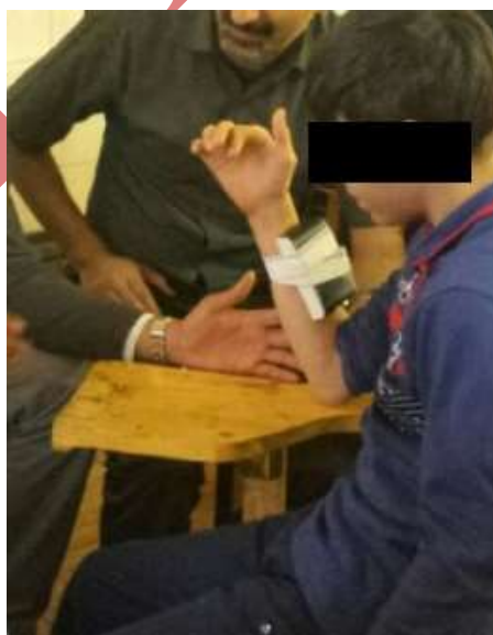
شکل ۲. اجرای تکلیف حس عمقی توسط شرکت‌کننده