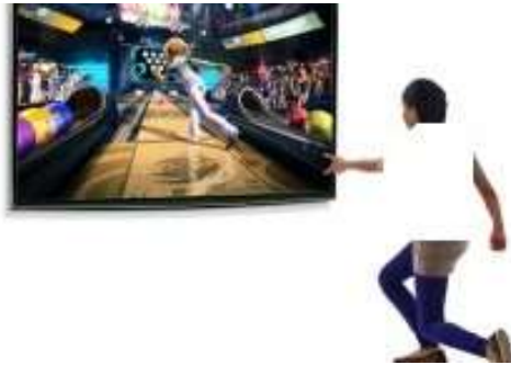
شکل ۳. تصویر شماتیک پرتاب بولینگ در بازی Xbox

به منظور انجام تمرینات واقعیت مجازی از دستگاه Xbox استفاده می‌شود. این دستگاه دارای رزولوشن تصویر 1920 \times 1080 ، و مجهز به ۵ پورت USB (Universal Serial Bus)، یک پورت مخصوص Kinect، خروجی‌های HDMI و AV، خروجی TOSLINK و همچنین شبکه بی‌سیم Wi-Fi بود.