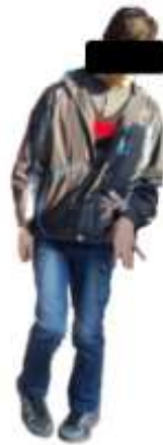
شکل ۱. تکلیف راه رفتن تعادلی

مداخلات تمرینی برای هر دو گروه آموزش خطی و غیرخطی به مدت چهار هفته، یک روز در میان به مدت یک ساعت بود. محیطی آرام برای کلیه مراحل تمرین در نظر گرفته شد. تمرینات و آزمون‌ها در یک نوبت (صبح‌ها) انجام گرفت. پس از اتمام دوره تمرینی، مجدداً شاخص‌های مربوط به تعادل ایستا در آزمودنی‌های گروه آموزش خطی و غیرخطی ارزیابی شد.